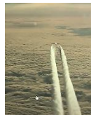
Sprühvorgang durch chemische Beimischung im Kerosin

Versprüht werden Chemtrails vom Militär auf Befehl mächtiger „Eliten“ und geheimer Logen, die außerhalb der Kontrolle von Regierungen operieren. Beteiligt sind einflussreiche NGOs, Pharma- und Finanzkonzerne, die UN, WHO, CIA, NASA. Boeing baut die Tanks in teils ausgemusterte Großraumflugzeuge, welche Mitarbeiter in Chemieschutzanzügen befüllen. In Deutschland starten diese Flugzeuge von einigen der 119 US-Militärstandorte, ohne Passagiere oder Flugkennung und versprühen tonnenweise diese giftigen Flüssigkeiten