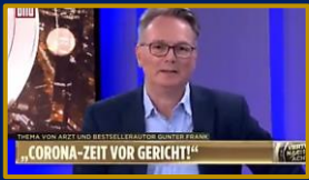
Es ist Zeit für die Wahrheit