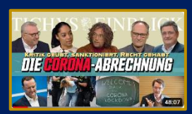
02/2023 Tichys Einblick