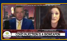
... es ist eine BIO-Waffe