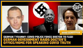
25.02.2023 Stew Peters Show