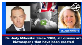
„Es sind BIO-Waffen“