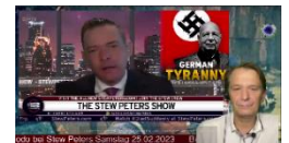
02/2023 Stew Peters deutsche Übersetzung

„Die COVID-Spritzen sind eine Bio-Waffe“, sagen medizinische Experten in Interviews bei Stew Peters. Auf FOX NEWS bringt Reporter Tucker Carlson ein Interview über die schrecklichen Nebenwirkungen der COVID-Spritzen.