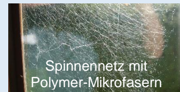
Spinnennetz mit Polymer-Mikrofasern