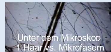
Unter dem Mikroskop 1 Haar vs. Mikrofasern