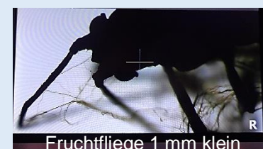
Fruchtfliege 1 mm klein