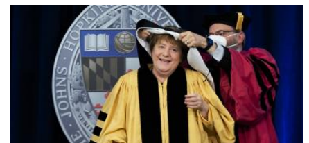
„Ich schwöre, zum Wohle . . . „ Im Ahrtal verlieren deutsche Bürger Haus, Gut und Leben während Angela Merkel zur selben Zeit in den USA ihren 17. Doktorhut feiert und danach Party macht.