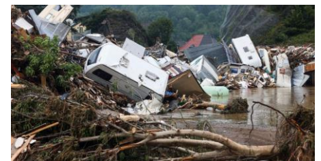
Flutkatastrophe im Ahrtal