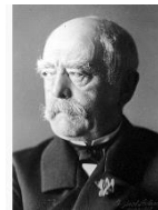
Bismarck 1890 Reichskanzler des DEUTSCHEN REICHES

In der Charta der Vereinten Nationen wird Deutschland immer noch als Feindstaat geführt. Was bedeutet das? Die Unterzeichnerstaaten können Zwangsmaßnahmen ohne besondere Ermächtigung durch den UN Sicherheitsrat gegen den „Feindstaat“ des Zweiten Weltkriegs verhängen, was auch ständig geschieht. Deutschland wird bis heute mangels Friedensvertrag aus einer Verwaltungsstruktur der Alliierten nach dem Zweiten Weltkrieg verwaltet. Für Westdeutschland sollten alle Hitler-Gesetze durch den SHAEF-Vertrag ersetzt werden. Leider ist das nicht der Fall. Hinzu kommt, dass die sogenannte BRD der Rechtsnachfolger des Deutschen Reichs von Hitler-Deutschland und nicht des Souveräns Kaiserreich ist. Allein aus dieser Kausalität kann es schon keine souveräne Struktur Deutschlands geben. Bis heute wenden deutsche Finanzämter Nazi-Gesetze an, was dadurch sehr viel Leid verursacht hat.